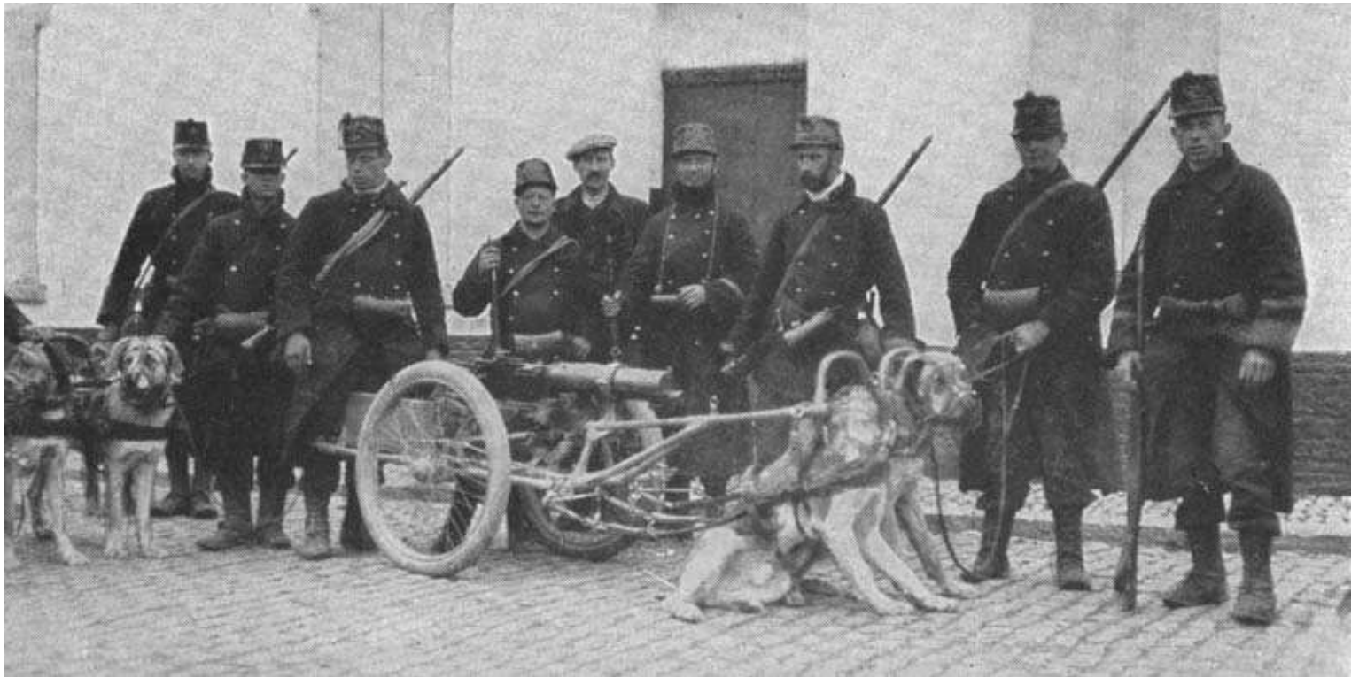
A Belgian machine gun battery drawn by dogs